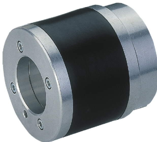
Pneumatic collar adapter serie PRA

Konstruktions-, Maß- u. Designänderungen vorbehalten | Technical measures, designs and constructions subjects to change without notice.